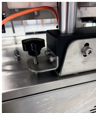
Regolazione lama di applicazione

TRX mini presenta funzioni di spegnimento automatico, di risparmio energetico, di gestione delle velocità del nastro e dell'etichettatrice, impostazioni del ritardo di stampa e del cilindro di applicazione e possibilità di abilitare e disabilitare la funzione di stampa/non stampa.